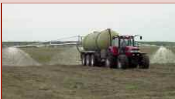
HTS 33.27 z rozlewaczem rzędownym 24,0 m

Przyczepy typu tridem ze zbiornikiem o pojemności 21 m 3 lub 27 m 3 zapewniające wydajność dzienną do 400 m 3