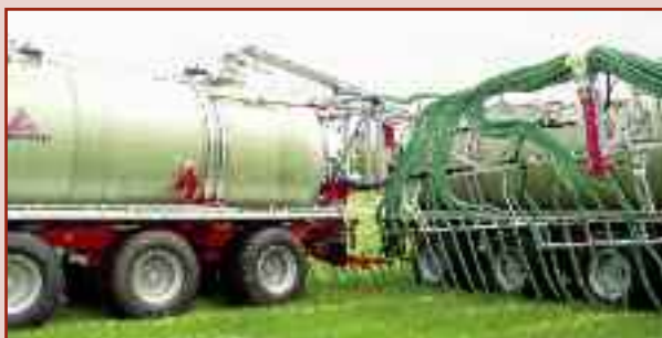
Maszyna HTS 33.27 jako przyczepa rozlewowa (z węzami rozlewającymi) i transportowa