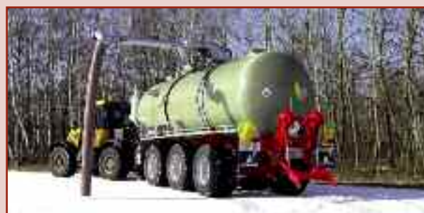
HTS 33.27 z hydraulicznym zawieszeniem trójpunktowym na różne adaptery

Jedna przyczepa asenizacyjna przeznaczona zarówno do transportu gnojowicy po drogach publicznych, jak i do jej rozlewania na polu wymaga wielu kompromisów. Z jednej strony duże i ciężkie adaptery rozlewowe stanowią problem w ruchu drogowym. Z drugiej zaś strony duże, szerokie ogumienie zapewniające łagodny nacisk na podłoże podlega znacznemu zużyciu na utwardzonych drogach i wymaga znacznie większej siły pociągowej, co w konsekwencji przekłada się na wyższe zużycie paliwa.