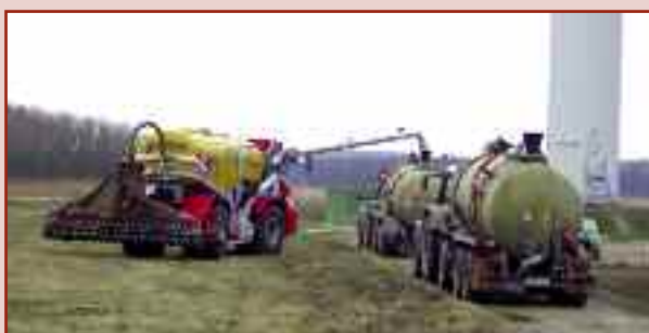
Nadwozie cysterny na samochód ciężarowy (pojemność 21,0 m 3 )

Przy optymalnym dostosowaniu przyczepy transportowej (dowożącej gnojowicę na pole) do przyczepy rozlewowej możliwe jest uzyskanie ogromnej wydajności dziennej. Napętnianie przyczepy rozlewowej odbywa się bardzo szybko i sprawnie dzięki nowoczesnym systemom dokowania.