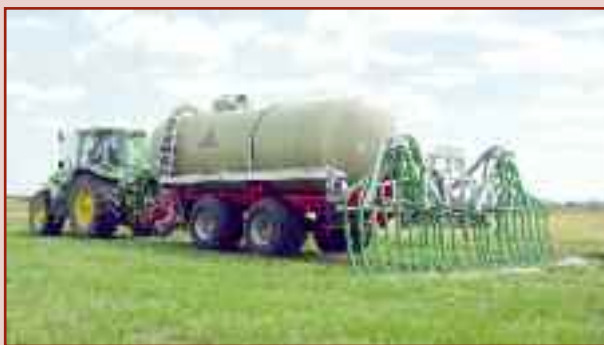
HTS 20.27 do transportu RSM

Przyczepy typu tandem ze zbiornikiem o pojemności 15 m 3 lub 18 m 3 zapewniające wydajność dzienną do 250 m 3