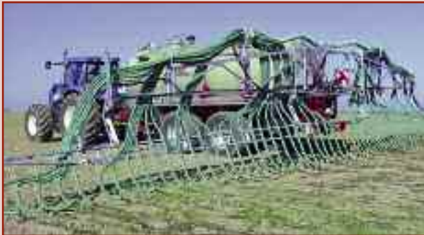
Rozlewacz z węzami wleczonymi