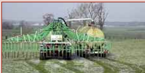
Przyczepa rozlewowa HTS 29.27 i 2x przyczepa transportowa HT 24.27

Przyczepy asenizacyjne napędzane ciągnikiem zapewniają wydajność dzienną > 600 m 3