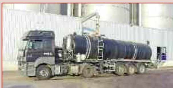
Naczepa na ciągnik siodłowy jako pojazd dowożący (pojemność 28 m 3 )

Naczepa asenizacyjna na ciągnik siodłowy lub grupa przyczep dowożących, przy pokonywaniu dużych odległości