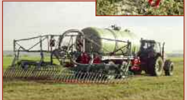
Rozlewacz z płozami wleczonymi