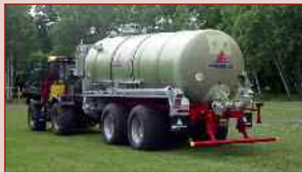
HTS 22.27 z rozlewaczem Möscha 18,0 m